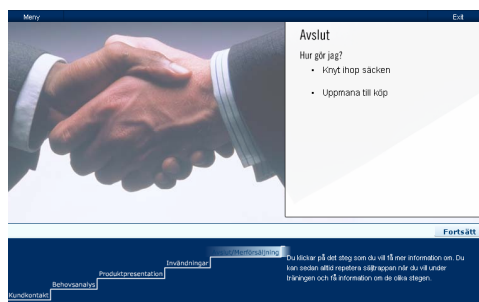
Säljprocessen ligger som grund i varje kunddialog som utförs i butiken.