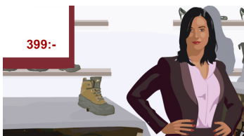
Försök att sälja ett par kängor till den här damen.

Butiksförsäljning grundläggande riktar sig till alla som vill utveckla sina kunskaper inom effektiv försäljning, kundpsykologi och hur säljare får kunden att känna sig i centrum.