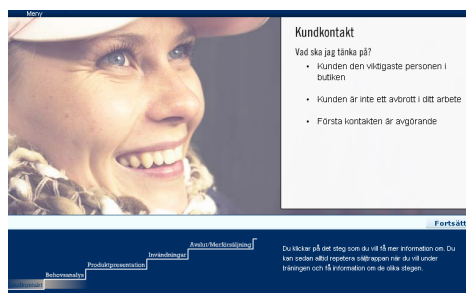
Säljprocessen ligger som grund i varje kunddialog som utförs i butiken.