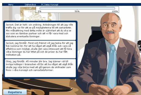
Kundsamtalen styrs utifrån de val du gör.